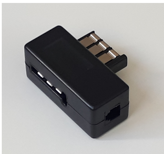
A PRISE TÉLÉPHONIQUE