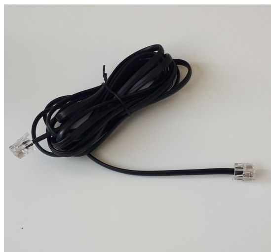
D CÂBLE TÉLÉPHONIQUE