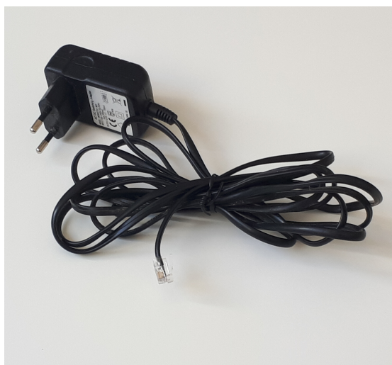
C PRISE D'ALIMENTATION